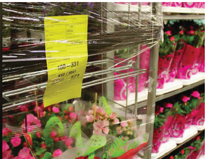
Tarrat kiinnitetään juuri kerättyyn erään. Tarrasta näkee, minne pakkaus on matkalla.