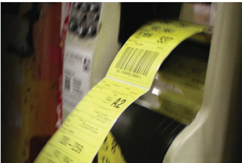
Ruokakeskon varastolla tarratulostimet ovat kovassa käytössä. Välillä laitteiden paikkoja vaihdellaan niiden kuormituksen tasaamiseksi.